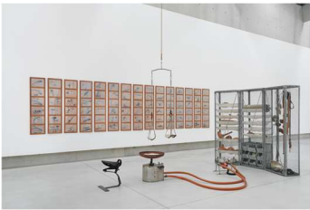
Cornelius Kolig (© 2026 Bildrecht, Wien) Tastgrammatik, 1975