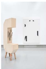
Fabian Seiz (© 2026 Bildrecht, Wien) Cluster, 2022