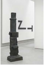
Fritz Wotruba (© Fritz Wotruba Privatstiftung, Wien, 2026) Große stehende Figur, 1962