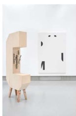
Fabian Seiz (© 2026 Bildrecht, Wien) Cluster, 2022