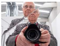
Selbstportrait: © Walter Schramm

Die Publikation „ Kunst im Dialog – Walter Schramm – Fotografien 2008–2017 · Museum Liaunig “ mit einem Vorwort von Peter Baum ist im Verlag Bibliothek der Provinz erschienen (ISBN 978-3-99028-759-0).