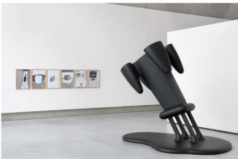
Werner Reiterer (© 2026 Bildrecht, Wien) Bang the Bomb! (aus der Serie Die gezeichneten Ausstellungen ), 2008 A Couple Having Sex in a Box (aus der Serie Die gezeichneten Ausstellungen ), 2007 Ohne Titel (aus der Serie Die gezeichneten Ausstellungen ), 2010 Ohne Titel (zerstörte Dan-Graham-Skulptur, aus der Serie Die gezeichneten Ausstellungen ), 2010 Ohne Titel (aus der Serie Die gezeichneten Ausstellungen ), 2010 Panzer mit Heiligenschein (aus der Serie Die gezeichneten Ausstellungen ), 2007 Julie Hayward (© 2026 Bildrecht, Wien) I wanna go home, 2011