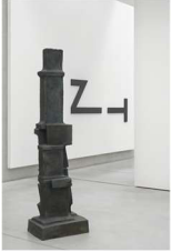
Fritz Wotruba (© Fritz Wotruba Privatstiftung, Wien, 2026) Große stehende Figur, 1962